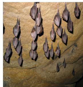
Wirus stwierdzony był najczęściej (ok. 90%) u mroczka późnego

Wścieklizną od nietoperza można się zarazić w wyniku pogryzienia, kontaktu z jego śliną lub moczem i przedostania się wirusa przez uszkodzoną skórę lub błony śluzowe. Rzadko notowana droga aerogenna zakażenia aerozolem ich odchodów jest możliwa w środowisku gromadzących się nietoperzy, w ich noclegowniach (jaskinie).